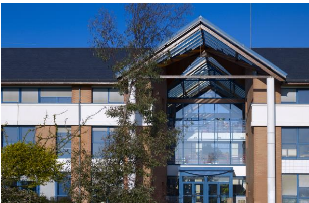
Site du Port